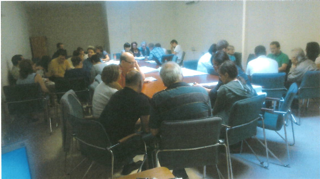
Csoportmunka a projektindító napon