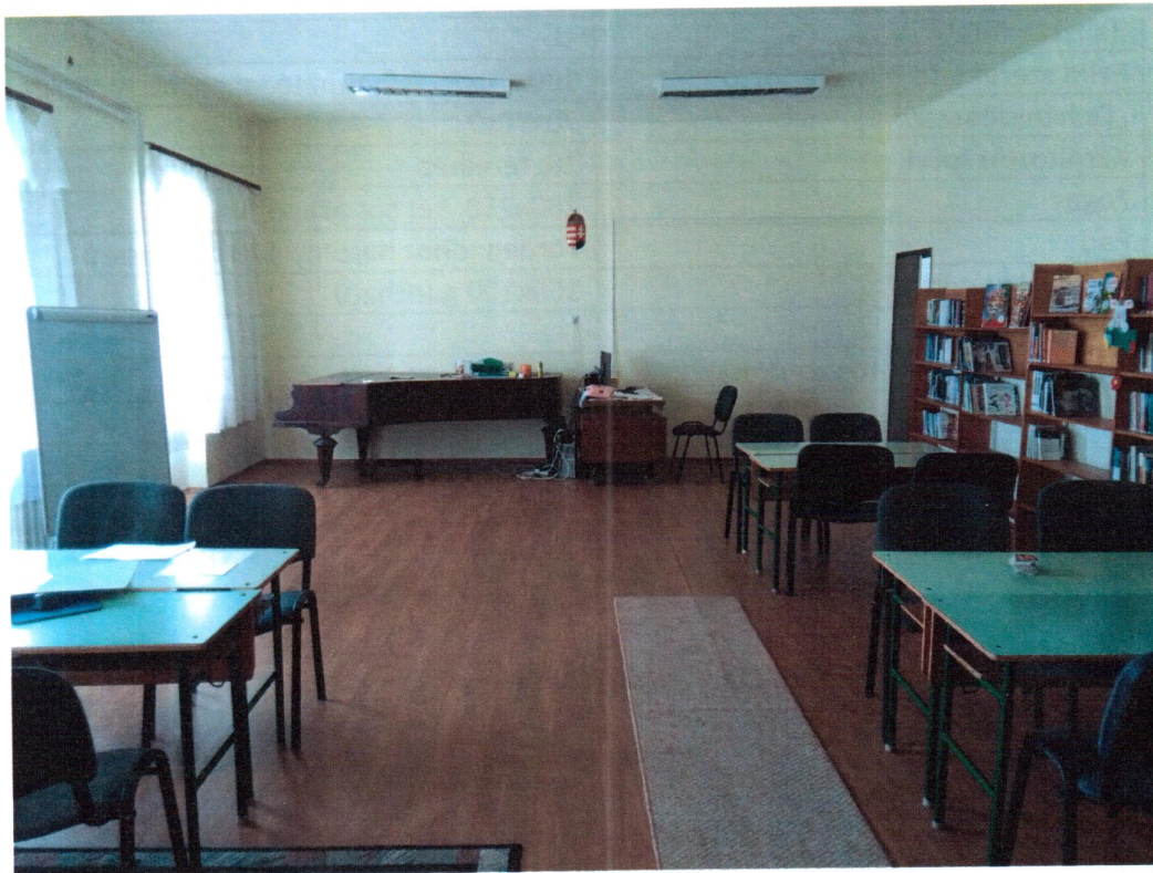
Bútor Pályázat után: