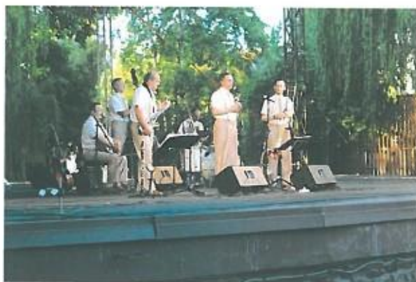
HOT JAZZ BAND zenekar