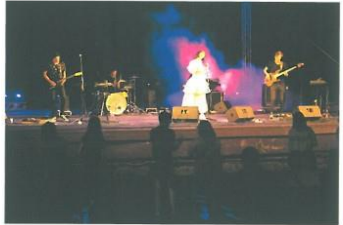
Magashegyi Underground zenekar