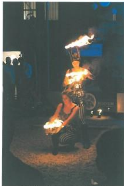
Sárkánylányok - Tűztánc