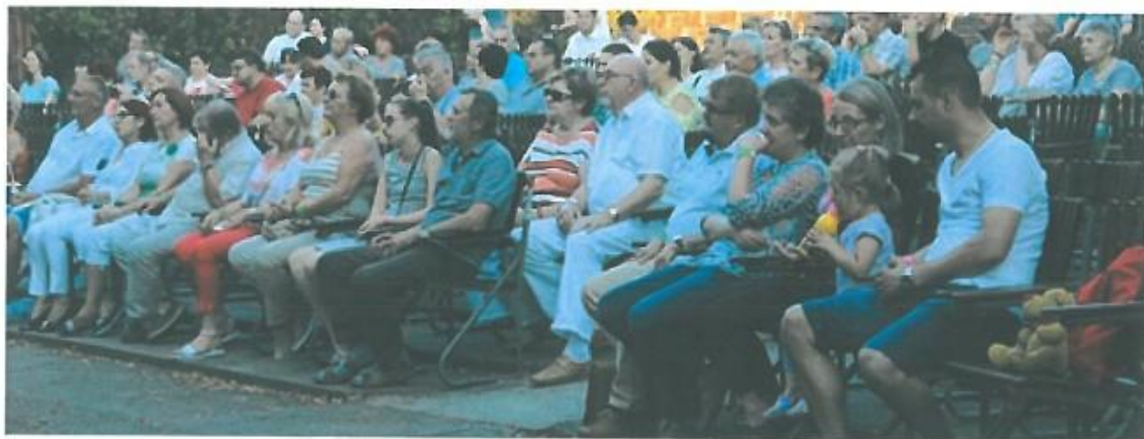
HOT JAZZ BAND koncert közönségének egy része