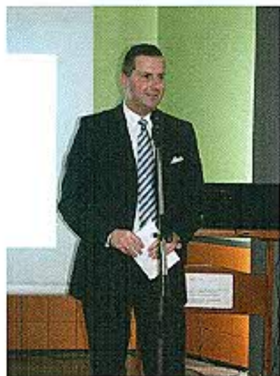
Balaicz Zoltán polgármester köszöntője