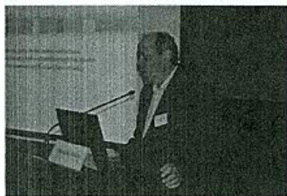
A szegedi KSZR műhelynapok előadói és a résztvevők

A másnapi kistérségi nap megszervezésénél fontos szempontunk volt, hogy olyan könyvtárakat látogassunk meg, ahol újabb tapasztalatokkal, ötletekkel gazdagodhatnak a könyvtáros kollégáink a KSZR, illetve a kistéleplési könyvtári munkáról.