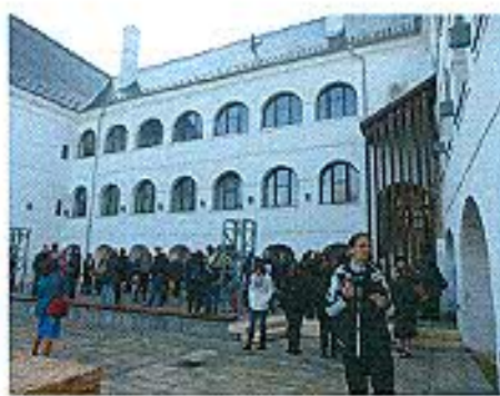
Egervár Nádasdy-Széchenyi Várkastély és Reneszánsz Látogatóközpont