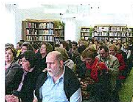
Pacsa Könyvtári Információs és Közösségi Tér