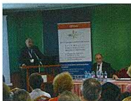
Fehér Miklós Könyvtári Intézet osztályvezetője előadása