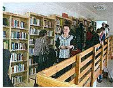
Egervár Könyvtári Információs és Közösségi Tér