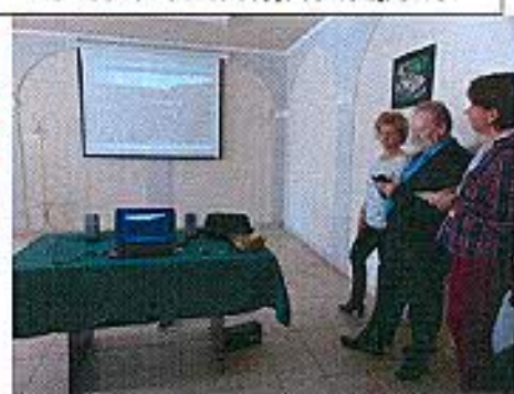
Nagypáli A településről szóló film megtekintése