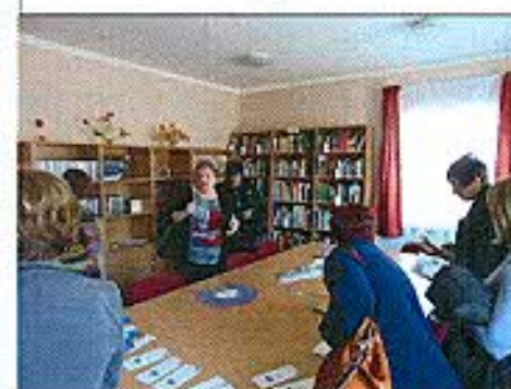
Nagypáli Könyvtári Információs és Közösségi Tér