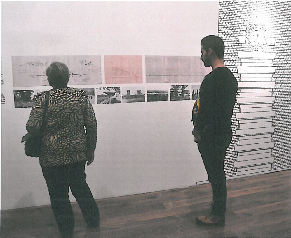
- A cívisváros Stefániája – villák a Nagyerdőn