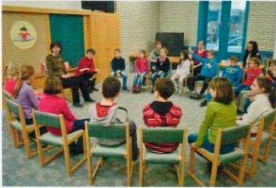
Turbuly Lilla és a kisiskolások